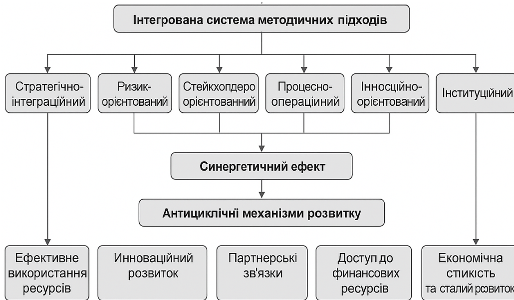
Рис. 1. Методичні підходи до управління економічною стійкістю будівельних підприємств в умовах циклічної економіки